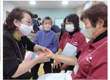
いい輪ネットおかわ ハンドマッサージと元気ダンス体験会