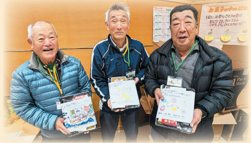
小川地区の福祉員さん（35名）にご協力いただきました。

福祉員の皆さまのおかげで、地域の高齢者や支援が必要な方々が、穏やかな新年を迎えることができました。このご協力は、地域の絆を深める大切なものです。