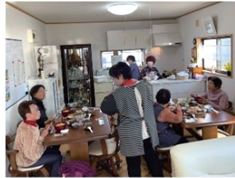
サロン・アロハ 一人暮らし年越しそば会食会