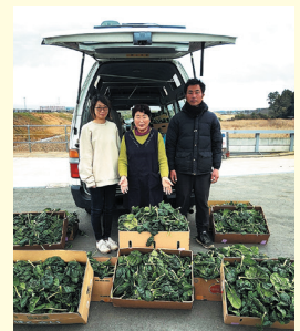
コーンラボ藤田・(株)フジタファーム 様

お預かりした寄付物品は、全18項目に分けて掲載させていただいております。 (例) 食料品・・・米、野菜、レトルト食品、缶詰、カップ麺など その他は、本会ホームページや二次元コードからご確認ください。