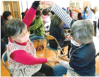
希望ヶ丘サロン クリスマス会で介護予防講座

12月1日から1月15日の期間に人と人がつながる「支え合い・助け合い」の地域づくりを目的に事業を実施していただいた11団体へ活動費の一部を助成しました。