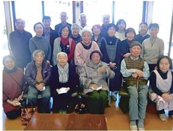
坂上サロン・さわやかクラブ 年末歌声喫茶