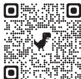
▲一部車両の動画をご紹介します