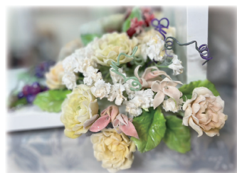
粘土の花アクセサリー 佐々木八千枝作