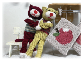
毛糸小物 豊原秀子作