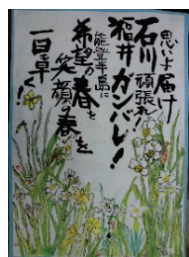
絵手紙同好会の皆さまより