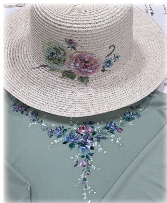
手描きファッション 山田春代作