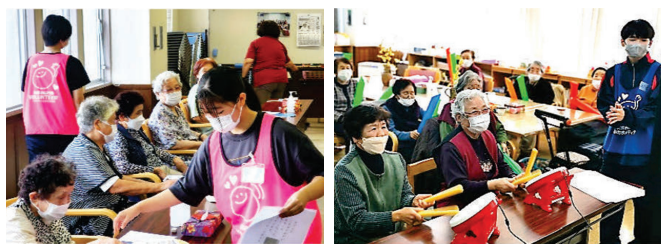
学生ボランティア

多様化・複雑化する地域課題への対応や既存の制度では解決が困難な複合的な課題を抱える世帯に対して、包括的な支援が柔軟に行えるように関係機関との連携を強化するとともに、基幹型相談支援センターの受託に向けた協議を行いました。